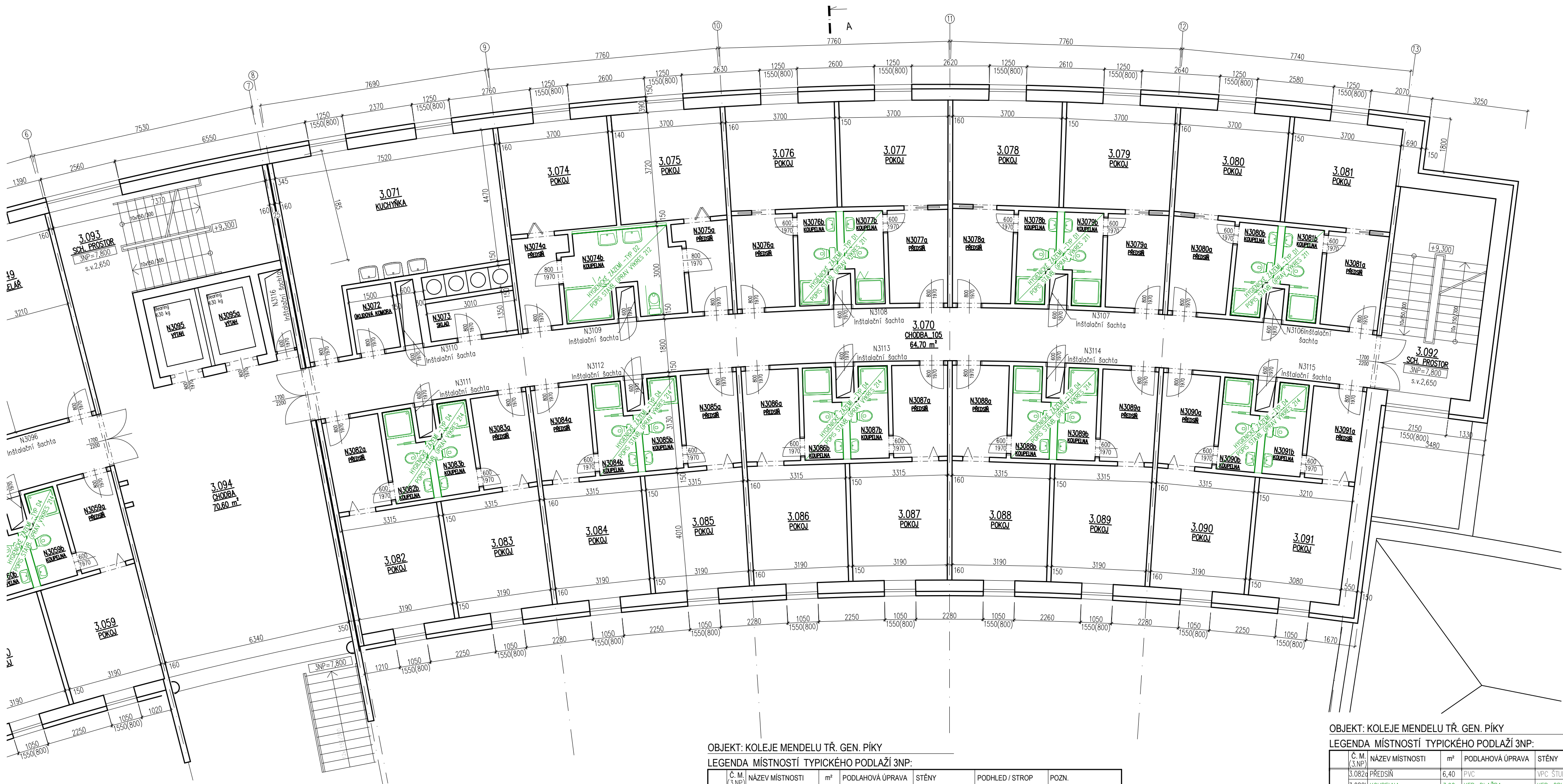
OBJEKT: KOLEJE MENDELU TR. GEN. PÍKY